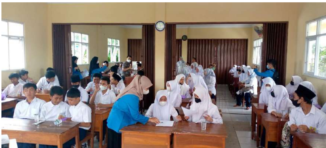
Gambar 2. Tim PkM memberikan motivasi ke murid-murid MTs. Baitis Salmah Ciputat