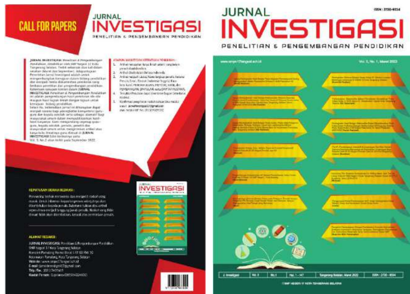
Gambar 2. Publikasi Jurnal Investigasi Vol. 3 No. 1

Hasil pelatihan penulisan naskah ilmiah yang diikuti oleh guru-guru SD, SMP, dan SMU/SMK Kota Tangerang Selatan setelah melalui proses proses penerimaan naskah, editor, reviewer, layout, maka naskah ilmiah tersebut dipublikasikan/dicetak pada Jurnal Investigasi Volume 3 Nomor 1 Bulan Maret-Agustus 2022. Seperti ditunjukkan dalam Gambar 2.