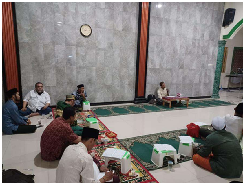
Gambar 2. Sambutan dari perwakilan PAC Gerakan Pemuda Anzor

Menurut Slamet Suyanto (2012:3), karakter diartikan sebagai nilai-nilai, sikap, dan perilaku yang dapat diterima oleh masyarakat luas. Misalnya: etis, demokratis, hormat, bertanggung jawab, dapat dipercaya, adil dan fair , serta peduli, yang bersumber dari nilai-nilai kemasyarakatan. Seyogianya mereka dilibatkan dalam berbagai kegiatan yang membutuhkan tanggung jawab mereka. Anak-anak diberi pengarahan tentang bagaimana bertanggung-jawab pada kegiatan yang diberikan.