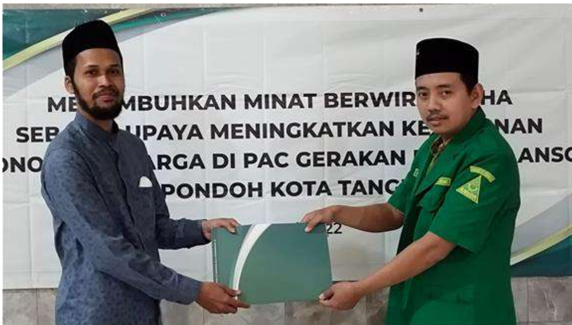
Gambar 1. Penyerahan cenderamata kepada Ketua PAC Gerakan Pemuda Ansor