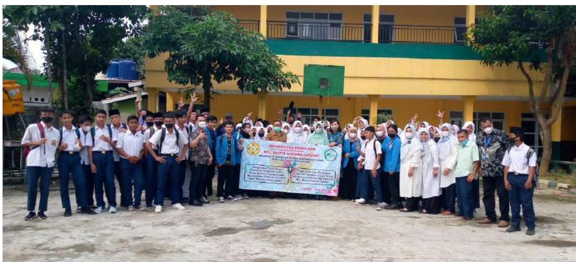
Gambar 2. Foto bersama Tim PkM dengan pimpinan sekolah dan murid-murid MTs. Baitis Salmah Ciputat

Berdasarkan hasil survei, observasi, dan informasi dari pimpinan sekolah adanya perubahan kebiasaan hidup dan semakin meningkatnya teknologi yang dibutuhkan dalam kehidupan manusia sekarang ini. Hal tersebut menjadi tantangan bagi para pendidik dan orang tua serta pemerintah dalam memberikan pendidikan dan pengalaman kepada para murid-murid di sekolah. Selain itu di rumah dan lingkungan tempat tinggal juga dibutuhkan suasana yang ramah dengan anak-anak dan memberikan fasilitas dan sarana yang sesuai dengan kebutuhan mereka.