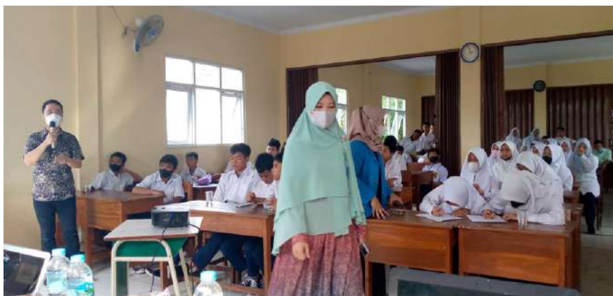
Gambar 1. Suasana PkM di MTs. Baitis Salmah Ciputat

Adapun feedback dari murid-murid MTs. Baitis Salmah Ciputat khususnya kelas VII dan VIII yaitu sangat antusias dan mengerti tentang profil pelajar Pancasila dan bagaimana cara untuk memiliki karakter pelajar Pancasila serta menjadi manusia yang unggul. Kegiatan ini akan terus berlanjut pada semester berikutnya dengan menambah khazanah ilmu untuk mereka.