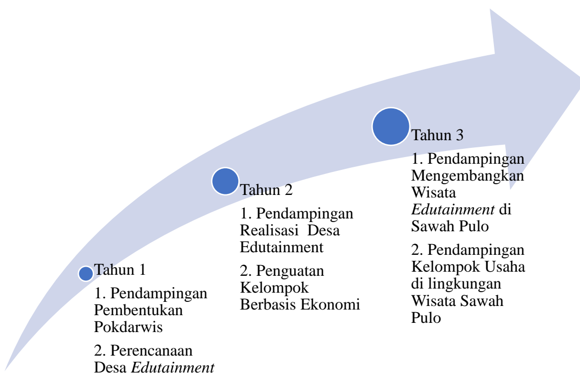
Gambar 3. Skema PPDM

Adapun road map kegiatan PkM dengan Skema PPDM sebagaimana tampak pada Gambar 3.