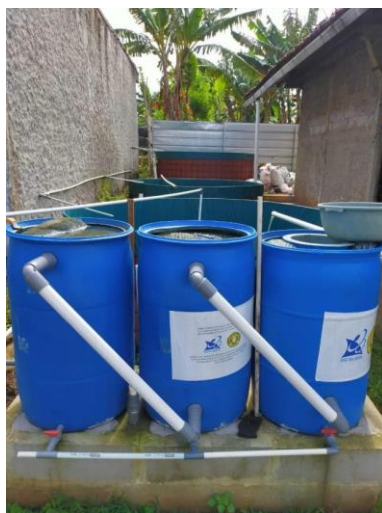
Gambar 1. Sarana budidaya ikan milik kelompok

Berdasarkan data sebaran penduduk sesuai jenis pekerjaan terlihat peternak yang jumlahnya kecil yaitu 3 orang. Ini merupakan jumlah peternak ikan yang ada di Desa Curug, Kecamatan Gunung Sindur, Bogor. Desa ini memiliki struktur wilayah yang sangat mendukung dikembangkannya ternak ikan, khususnya lele. Misalnya, akses transportasi yang sangat mudah terjangkau, lokasi pemasaran lokal yang dekat dengan tempat ternak, faktor keamanan, dan kemudahan akses ke administrasi pemerintahan.