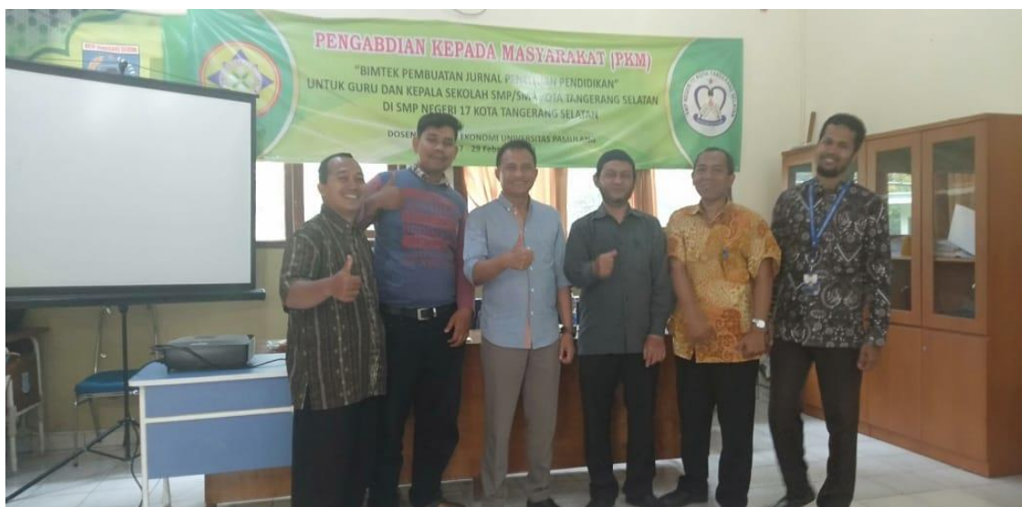
FOTO KEGIATAN PENGABDIAN KEPADA MASYARAKAT BIMTEK PEMBUATAN JURNAL PENDIDIKAN