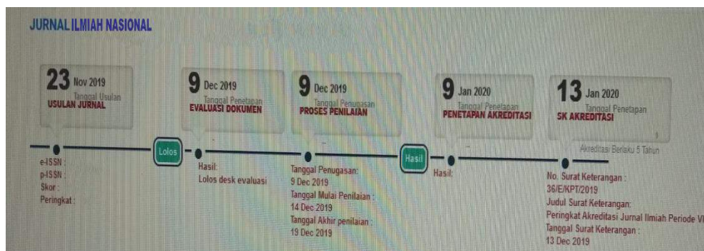
Gambar 2. Proses penilaian akreditasi jurnal nasional

Setelah usulan jurnal sudah masuk dalam proses pengajuan, maka tahap yang selanjutnya dilakukan adalah evaluasi dokumen, proses penilaian, penetapan akreditasi, dan terakhir adalah SK Akreditasi. Hal itu sebagaimana tampak pada Gambar 2.