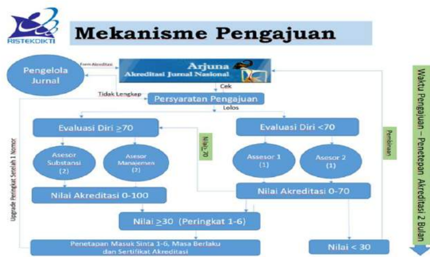
Gambar 1. Mekanisme pengajuan akreditasi jurnal nasional

Selanjutnya dalam pengajuan akreditasi jurnal ilmiah nasional tidak hanya sekadar mendaftarkan jurnal yang diakreditasi. Setiap pengelola wajib mengikuti mekanisme yang sudah ditentukan oleh Kemenristek/BRIN. Hal itu sebagaimana terlihat pada Gambar 1.