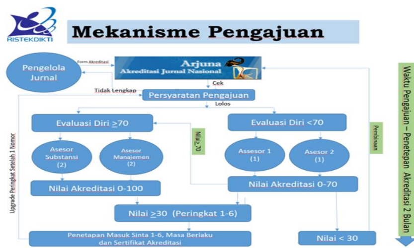
Gambar 1. Mekanisme pengajuan akreditasi jurnal nasional

Selanjutnya dalam pengajuan akreditasi jurnal ilmiah nasional tidak hanya sekadar mendaftarkan jurnal yang diakreditasi. Setiap pengelola wajib mengikuti mekanisme yang sudah ditentukan oleh Kemenristek/BRIN. Hal itu sebagaimana terlihat pada Gambar 1.