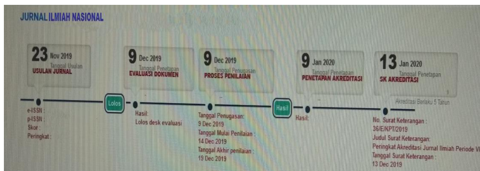
Gambar 2. Proses penilaian akreditasi jurnal nasional

Setelah usulan jurnal sudah masuk dalam proses pengajuan, maka tahap yang selanjutnya dilakukan adalah evaluasi dokumen, proses penilaian, penetapan akreditasi, dan terakhir adalah SK Akreditasi. Hal itu sebagaimana tampak pada Gambar 2.