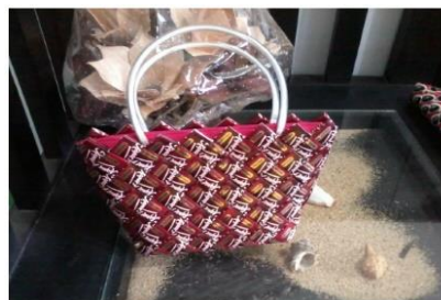
Gambar 2. Produk Daur Ulang Bank Sampah Lestari 25

Meskipun kelompok masyarakat yang tergabung dalam kelompok Bank Sampah cukup banyak dan memberikan kontribusi yang besar bagi perekonomian nasional, namun sebagian besar Bank Sampah mengalami kesulitan dalam mengembangkan usahanya. Salah satu, persoalan yang dihadapi oleh UMKM Bank Sampah yaitu manajemen usaha dan keuangan.