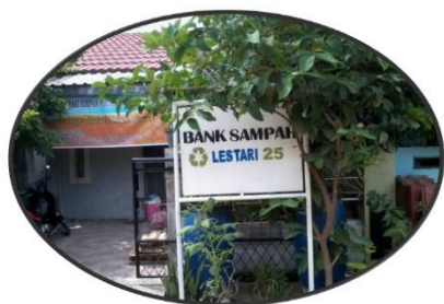
Gambar 1. Lokasi Bank Sampah Lestari 25