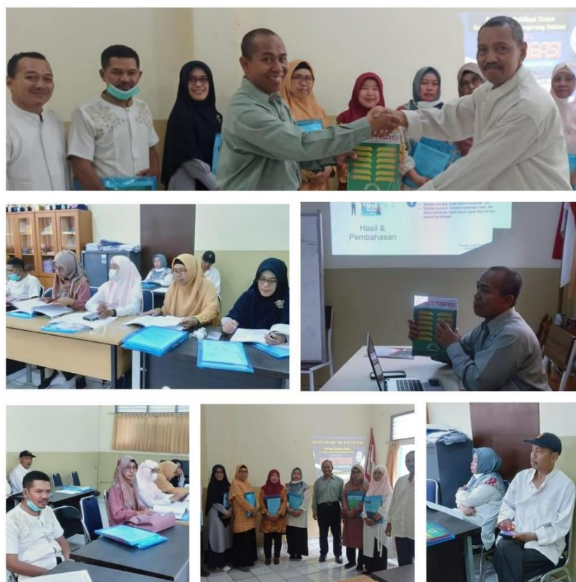
Gambar 3. Dokumentasi kegiatan pengabdian kepada masyarakat