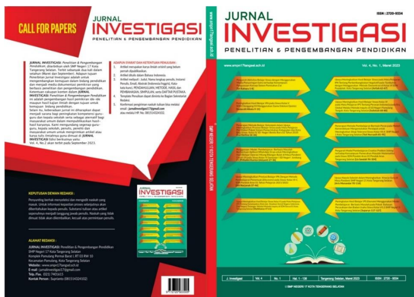
Gambar 2. Cover Jurnal Investigasi Vol. 4, No. 1

Hasil pelatihan penulisan naskah ilmiah yang diikuti oleh guru-guru SD, SMP, dan SMU/SMK se Kota Tangerang Selatan setelah melalui proses proses penerimaan naskah, editor, reviewer , dan layout , maka naskah ilmiah tersebut dipublikasikan/dicetak pada Jurnal Investigasi Volume 4 Nomor 1 Bulan Maret-Agustus 2023.