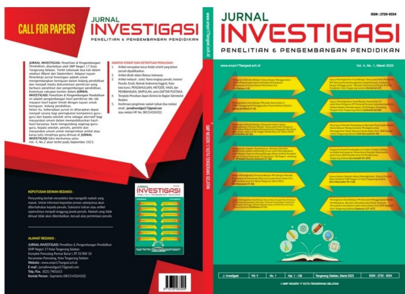
Gambar 2. Cover Jurnal Investigasi Vol. 4, No. 1

Hasil pelatihan penulisan naskah ilmiah yang diikuti oleh guru-guru SD, SMP, dan SMU/SMK se Kota Tangerang Selatan setelah melalui proses proses penerimaan naskah, editor, reviewer , dan layout , maka naskah ilmiah tersebut dipublikasikan/dicetak pada Jurnal Investigasi Volume 4 Nomor 1 Bulan Maret-Agustus 2023.